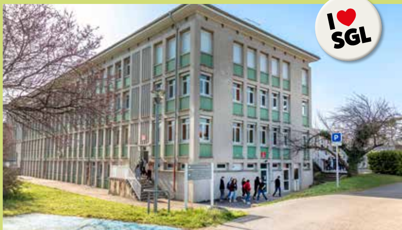
Le lycée Paillot forme, 300 étudiants chaque année.

Également, une vente grand public est organisée tous les vendredis après-midi au lycée. À partir de fin mai, ces produits transformés seront d'ailleurs vendus (un dimanche par mois) sur le nouveau