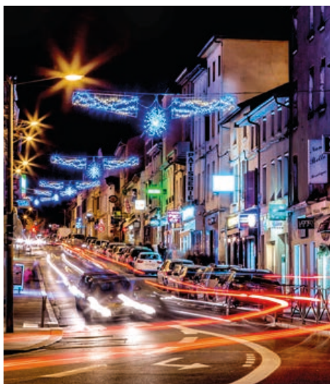
La commune affiche une baisse de 13% des consommations d'énergie entre 2012 et 2107.

Les bonnes nouvelles doivent se partager, surtout lorsqu'elles concernent un secteur qui fait débat et mobilise : les énergies.