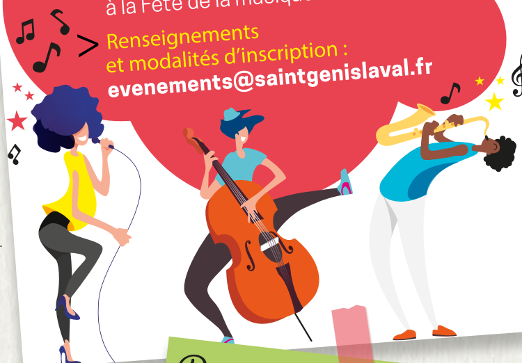
illustration : christellebouvigne.fr

Renseignements et modalités d'inscription : evenements@saintgenislaval.fr