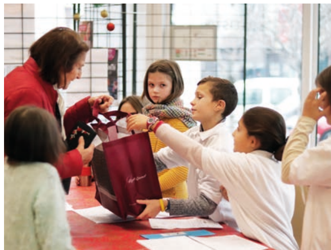
Distribution des coffrets de Noël aux seniors par les enfants du CME.

2 nouveaux arrêts de bus à l'intersection route de Brignais / chemin de pressin seront mis en place courant février. L'objectif ? Sécuriser la traversée piétonne par la mise en place de feux tricolores et permettre aux lycéens de passer par le chemin de Pressin pour accéder au lycée horticole. Ils évitent ainsi le chemin de Beaunant, plus fréquenté par les automobilistes.