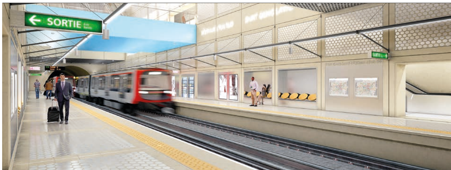
◆ La future station Saint-Genis-Laval Hôpitaux Sud, nouveau terminus de la ligne B du métro.