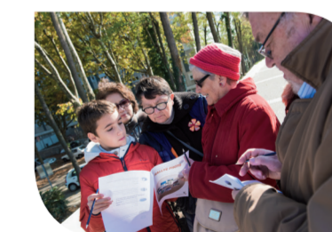
La semaine bleue