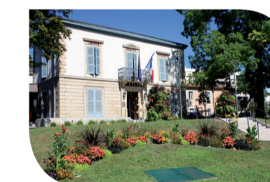
La mairie à votre service