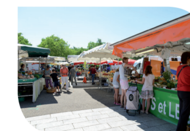
Profiter du marché