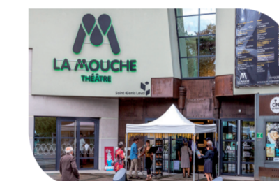
Théâtre & Cinéma la Mouche