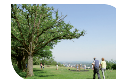
Une ville à la campagne