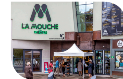
Théâtre & Cinéma la Mouche