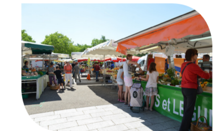
Profiter du marché