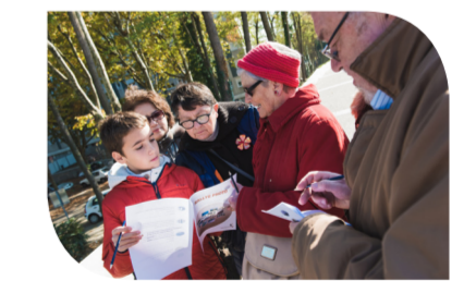
La semaine bleue