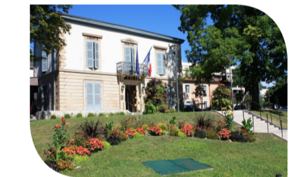
La mairie à votre service