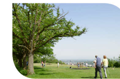
Une ville à la campagne