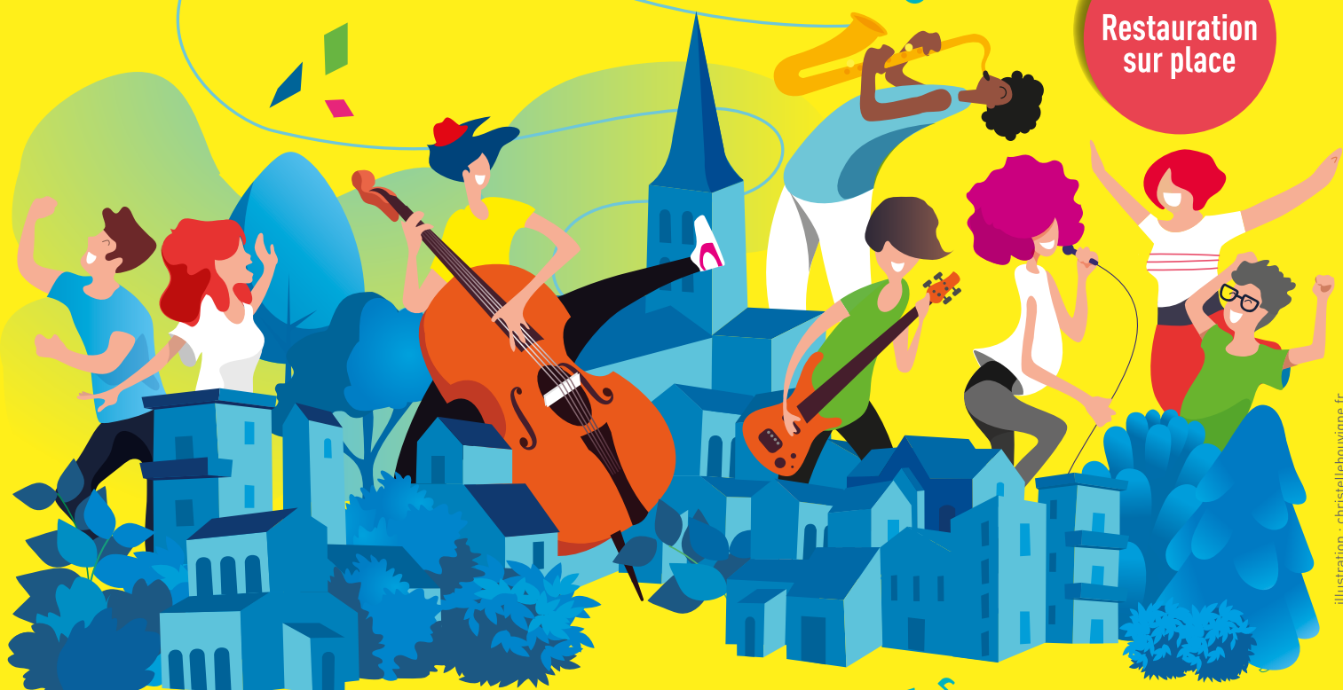
illustration : christellebouvigne.fr

Dans le centre-ville de Saint-Genis-Laval