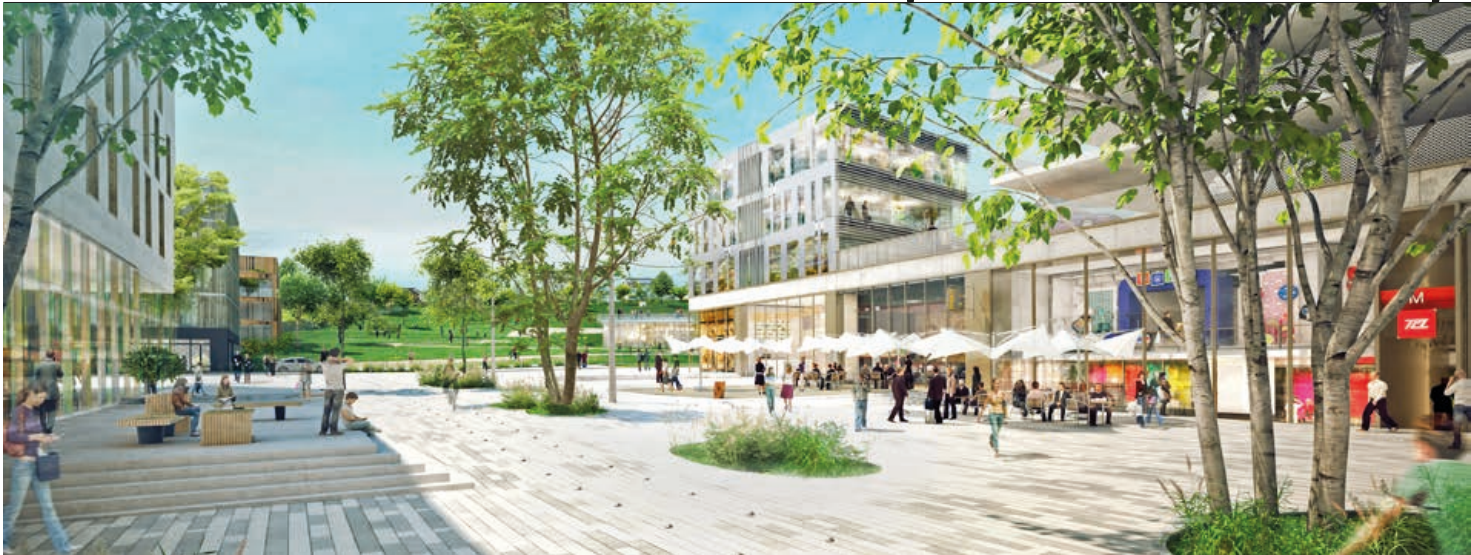
◆ La future place d'accès au métro de Saint-Genis-Laval.