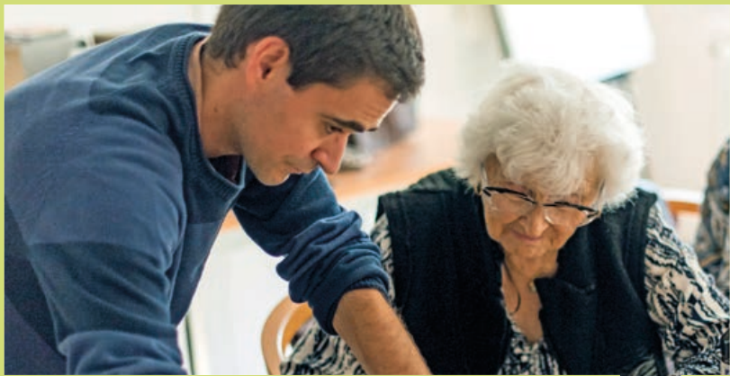
Écoute, conseils et solutions apportés aux aidants.

Pour soutenir les Saint-Genois s'occupant d'un membre de leur famille âgé, malade ou en situation de handicap, la Ville propose des ateliers intitulés « L'aidant au cœur de la famille ». Ces rencontres sont animées par des professionnels spécialisés en gérontologie et apportent des réponses concrètes et rassurantes.