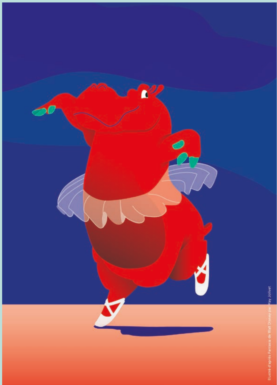
Illustration d'après Fantasia de Walt Disney par May Jolivet